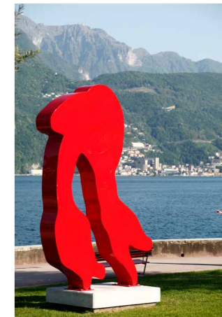
Rotraut, Life, Painted aluminium, 353 x 244 x 50 cm Artwork © Rotraut, ADAGP, Paris | BILDKUNST, Bonn, 2016