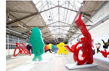
Blick in den Ausstellungsraum, Jena, 2016 Artwork : © Rotraut, ADAGP, Paris | BILDKUNST, Bonn, 2016