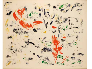
Rotraut, Vol de sensibilité, ca. 1963 Gouache auf Papier, 89 x 109,5 cm Artwork © Rotraut, ADAGP, Paris | BILDKUNST, Bonn, 2016