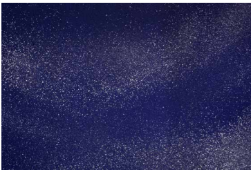
Rotraut, Galaxie, 1987 Acryl auf Leinwand, 136 x 285 cm Artwork © Rotraut, ADAGP, Paris | BILDKUNST, Bonn, 2016